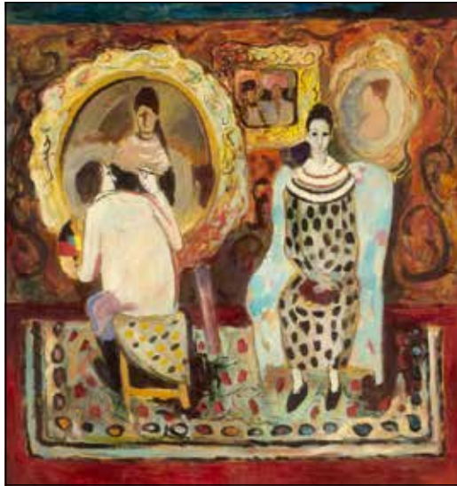
Vytautas Kasiulis, Femme chez le peintre , 1948.

Vytautas Kasiulis peignait à l'huile, au pastel et réalisa de nombreuses lithographies. Pour toutes ses compositions, il choisit des motifs bien connus de la vie des rues parisiennes : musiciens, danseurs, artistes de cirque, marchés aux livres ou aux fleurs, ainsi que des scènes de l'atelier de l'artiste et des cafés. En 1960, avec l'aide du mécène américain d'origine lituanienne Juozas Kazickas (Joseph P. Kazickas), il acheta sa propre galerie d'art à Paris. Outre ses peintures, il exposait également les œuvres de représentants célèbres de l'École de Paris. Plus tard, l'artiste acheta une galerie plus grande en plein centre de la capitale, la Galerie Royale. Jusqu'en 1990, l'épouse de l'artiste, Bronė Kasiulienė, connue en français sous le nom de Bonite, d'après la forme lituanienne du nom Bronytė, y travailla activement. Beaucoup de ceux qui ont écrit sur l'œuvre de Kasiulis l'ont associé à l'École de Paris. Il a été comparé à Raoul Dufy, Georges Rouault, Marc Chagall et d'autres peintres célèbres de ce mouvement. Il est également très important de noter la vigueur et la persévérance particulières du couple Kasiulis, qui contribua fortement à conforter la place de cet artiste lituanien dans le monde de l'art parisien.