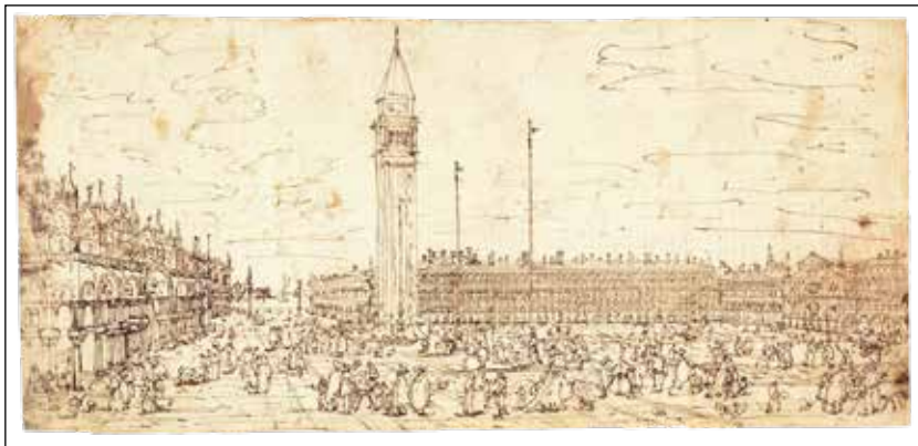
Bernardo Bellotto, Piazza San Marco vista dalla Torre dell'Orologio , gravure, 1735-1738, Hessisches Landesmuseum Darmstadt, collection Bojanus, Inv. AE 2211.