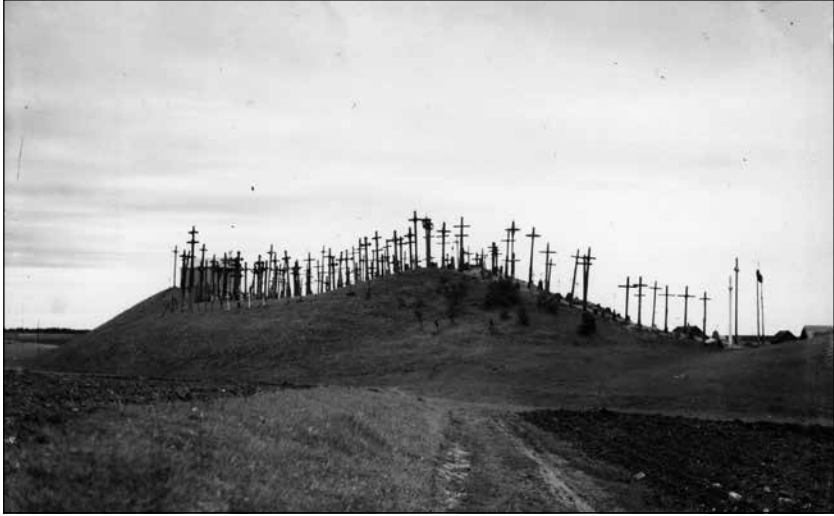
Colline des croix de Šiauliai, Jurgaičiai.