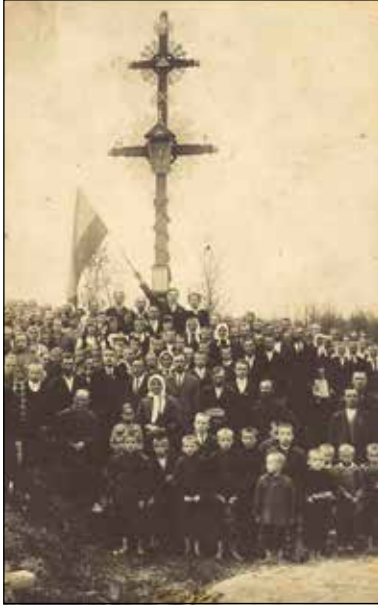
Fête du baptême de la Croix pour les 10 ans de l'Indépendance au village Šyliai en 1928.

Canada, au Brésil, en Australie, en Allemagne. L'idée de les fabriquer fut recueillie par le mouvement des Scouts, qui se mirent en particulier à travailler massivement ces croix chaque année pour la préparation de la traditionnelle foire de la Saint-Casimir (4 mars).