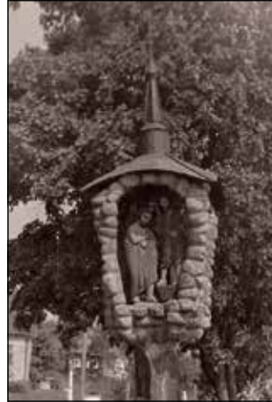
Poteau-chapelle fin XIX e siècle du sculpteur de croix Vincas Svirskis (1835–1916). Village Ibutoniai, district Kėdainiai (photo 1976, coll. privée).

Ainsi, dès le XIX e siècle, les nombreuses marques de piété – croix ( kryžiai ), poteaux-chapelles ( koplytstulpiai ), poteaux à toit ( stogastulpiai ), chapelles miniatures ( koplytėlės ) – sont-elles devenues indissociables du paysage lituanien. Pourtant, dès la seconde moitié de ce siècle, ces ouvrages, outre l'expression de la piété, ont acquis également des significations supplémentaires d'ordre symbolique. Cela est lié aux actes d'autorité de la Russie tsariste qui avaient créé et renforcé la signification politique de la croix. Comment cela est-il arrivé ? Se distinguant dans le paysage, ces croix ont accentué le caractère catholique de la Lituanie et l'ont séparée visuellement des autres territoires de la Russie. Cela a provoqué l'agacement et l'irritation des fonctionnaires russes pour lesquels des monuments comme les croix, les chapelles miniatures, les poteaux à toit « créent le désir de donner une apparence non-orthodoxe à cette région russe depuis longtemps orthodoxe (sic) ». C'est pourquoi le pouvoir tsa-