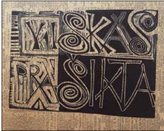
Žibuntas Mikšys, Viskas prašikta , 1955.

Cette œuvre graphique reflète également les futures recherches créatives de l'artiste, où les mots et les lettres joueront un rôle central dans la composition. Dans le même temps, éclate ici la netteté colorée du style de l'artiste, qui le rend célèbre tout autant que ses créations. Dans ses « graphiques de graphèmes », il considérait les lettres, les mots, les phrases