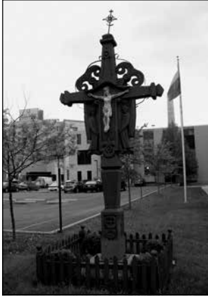
Croix sculptée par Jurgis Daugvila (1923–2008), Chicago.

Par ailleurs, la construction de croix dans des lieux publics ou leur présentation dans des expositions internationales permettaient de faire connaître le nom de la Lituanie. C'est dans cette intention que fut montré à l'exposition universelle de New-York (1964) le poteau à toit réalisé selon le projet de l'architecte Jonas Mulokas, dédié à « Ceux qui ont péri pour l'indépendance de la Lituanie ». Dans cette exposition, il n'y avait pas de pavillons nationaux séparés. C'est pourquoi il était essentiel d'obtenir l'autorisation de bâtir un monument lituanien pour les Litvaniens d'Amérique. Le poteau à toit fut choisi parce que cette forme exprime le mieux la souffrance de la Lituanie et montre la richesse et l'originalité de son art populaire, et parce que la Lituanie est connue dans le monde entier comme la terre des croix.