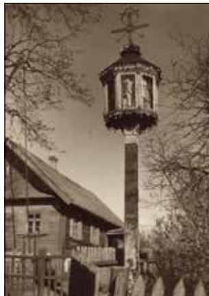
Poteau-chapelle à Šapnagai, district Šiauliai, daté de 1880 (photo 1926).

Plus l'administration tsariste interdisait les croix, plus les gens mettaient de ténacité à en dresser. L'exemple le plus flagrant de cette résistance se trouve dans les champs du village de Jurgaičiai, non loin de Šiauliai : au milieu du XIX e siècle, sur une petite colline commencèrent à s'élever des croix qui très vite créèrent et rendirent célèbre cette Colline des Croix. Rien n'en vint à bout, ni interdictions, ni destructions. Les croix détruites étaient très vite relevées la nuit et, en plus, s'en élevaient de nouvelles si bien que, sur la colline, leur nombre ne cessait d'augmenter. C'est dans le même contexte de la lutte du pouvoir tsariste contre l'identité nationale lituanienne que fut interdite l'impression des livres en caractères latins et l'apparition de la tradition des knygnešiai 1 .