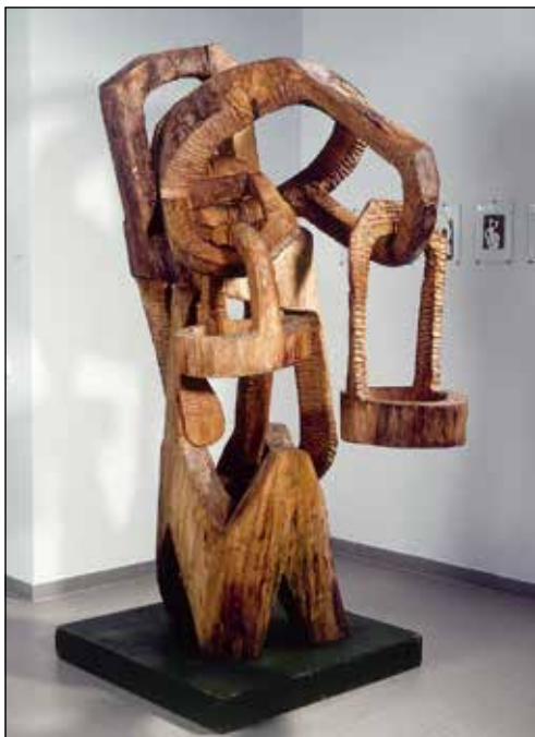
Antanas Mončas, La porteuse d'eau , 1970.

Plus tard, le sculpteur abandonna la représentation figurative, en passant de plus en plus vers une plastique moderniste et poético-constructiviste. Ses figures – humains ou oiseaux – se rapprochent ainsi d'une forme abstraite. Le dessin devint très important pour Antanas Mončas. Il disait que sa sculpture commence par un dessin et que dessiner pour lui est comme une prière. Ses dessins sont pour la plupart non concrets, difficiles à reconnaître dans la réalité. C'est une recherche de nouvelles formes qui n'existent pas dans la réalité, des figures invisibles et leurs relations.