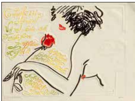
Pranas Gailius, D'un Bel Orient , 2.

En 1967-1968, Gailius créa des livres d'artiste fondés sur les motifs d'œuvres d'Oscar Milosz intitulées Le Livre Premier de la Suite Lithuanienne et La mer . Au Centre Pompidou où étaient exposés les livres précités, l'artiste rencontra le traducteur en français de la poésie d'Omar Khayyam. Cela l'intéressa et l'inspira pour créer l'immense série de gravures D'un Bel Orient , éditée comme livre d'artiste et imprimée en seulement 33 exemplaires. Chacune de ces copies contenait vingt magnifiques feuilles imprimées et signées par l'artiste lui-même. Les quatrains d'Omar Khayyam décrivent la beauté de la femme et de la vie, développent les thèmes de l'amour, du vin et de la joie. Pranas Gailius avait choisi ces