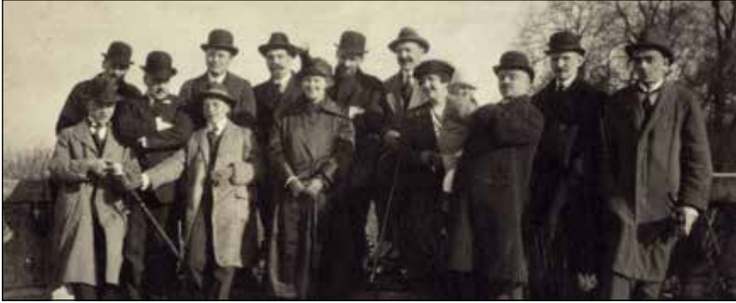
Délégation lituanienne à la Conférence de la paix de Paris. Paris, mars-avril 1919. Au premier rang, Oscar Milosz à l'extrême droite, Petras Klimas à l'extrême gauche, à côté de lui Kazimieras Česnulis représentant des Lituaniens aux États-Unis. Archives centrales d'État de Lituanie, P-27630.

Le début de la Première Guerre mondiale avait été favorable à l'Allemagne qui, à l'été 1915, occupa les deux gouvernorats de Russie peuplés de Lituaniens. Ayant l'intention de déclarer l'indépendance de la Lituanie, les hommes politiques lituaniens définirent à Vilnius, dès l'automne 1916, les frontières désirées, même si celles de l'ouest n'étaient définies que de manière abstraite et assez vague : « La Lituanie est liée à la mer par la frontière avec l'Allemagne ou par l'embouchure du Niémen et Klaipėda, au moins jusqu'à Šventoji ». 2 À la fin de la guerre, la question de ses frontières propulsa ainsi la Lituanie sur la scène politique internationale.