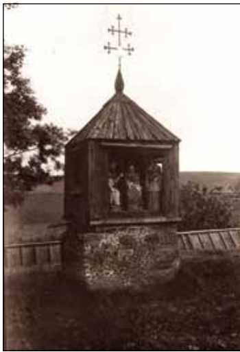
Chapelle miniature fin XIX e siècle à Užventis, district Kelmė (photo 1926).

Ainsi donc, à l'aube du rétablissement d'un État indépendant, on commença à concevoir la croix comme l'œuvre populaire reflétant le mieux le caractère national et le destin du peuple. En 1918 et dans les années qui suivirent l'indépendance, la création des croix se développa comme une partie singulière de l'art populaire, manifestant l'originalité, le caractère à la fois religieux et national de la culture. Cet art fut activement popularisé par l'imprimerie et dans des expositions locales. À Kaunas, dans le jardin du Musée de la guerre, près du monument Aux morts pour la liberté , furent élevés croix et poteaux-chapelles représentant différents types de monuments de l'art des croix, avec une riche ornementation, et reflétant aussi les particularités régionales et ethnographiques de cet art.