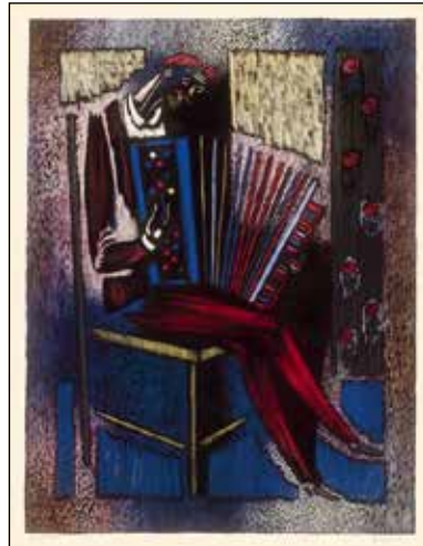
Vytautas Kasiulis, L'accordéoniste , 1950.

présentaient des œuvres peintes à Fribourg. L'une des plus belles œuvres de Vytautas Kasiulis, peinte à Fribourg, est la composition Femme chez le peintre (1948). Dans cette toile, apparaissent les plus marquantes caractéristiques du travail de l'artiste : le caractère décoratif, la douceur des contours des objets, la douceur du trait, la tendance à esthétiser les objets représentés. La femme dans l'œuvre de l'artiste était l'un des thèmes les plus délicats qui l'a accompagné tout au long de sa vie créative. Son admiration pour l'œuvre d'Henry Matisse a joué un rôle important dans la formation de l'œuvre de Kasiulis.