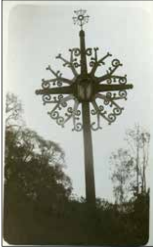
Croix au village Skirsnemunė, district Jurbarkas (photo 1922).