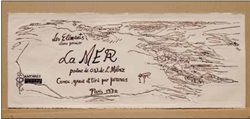
Pranas Gailius, La Mer , I de la série Les Éléments .

Rubaiyat qui parlent métaphoriquement du caractère éphémère de la vie et soulignent la fragilité de l'existence humaine. L'artiste avait cherché à transmettre l'émotion du texte poétique en utilisant un langage artistique abstrait et en entrelaçant des motifs plus réalistes représentant un corps de femme nue, des roses et des verres à vin. Les textes en français se fondent organiquement dans la trame du dessin.