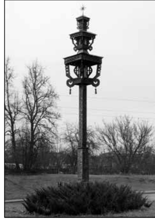
Poteau à toit à Jonava de 2005.

Les gens s'efforçaient aussi de réparer les croix et autres monuments qui se dressaient dans leurs fermes. Mais, s'ils étaient trop abîmés, ils ne craignaient