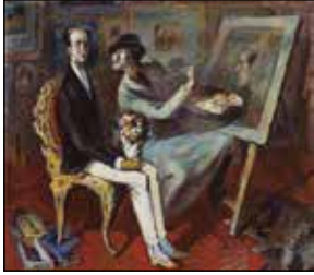
Vytautas Kasiulis, Le portraitiste , 1948.

œuvres étaient déjà présentées à l'occasion de l'exposition d'une centaine des plus célèbres artistes parisiens au musée Galliera.