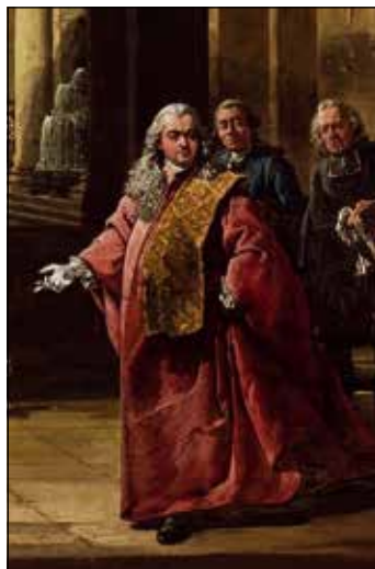
Bernardo Bellotto, autoportrait comme noble vénitien (détail, 1765).