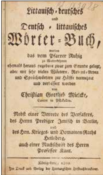
Page de titre de l'édition originale (1800) du Wörter-Buch (coll. BNU).

August Gotthold (1778-1858), les autres doubles provenant de la bibliothèque elle-même. Ce « pan mémoriel » est aujourd'hui, après la disparition de Königsberg, symboliquement plus important encore, comme témoin librement accessible d'une civilisation et d'une culture dont les traces ont été délibérément, sinon détruites, du moins dispersées après 1945 et la mainmise de l'Union soviétique sur l'ancienne Prusse-Orientale 3 . Quoique le fonds soit parfaitement accessible aujourd'hui, de même que les deux cahiers d'inventaire qui en donnent la liste 4 , et que son histoire soit désormais écrite, il n'a encore jamais vraiment été l'objet de recherches systématiques quant à l'intérêt réel de son contenu.